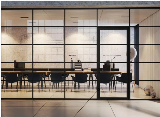
przeszkłona ściana w stylu loftowym